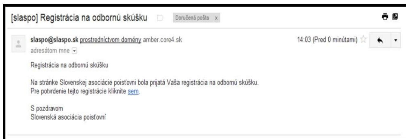
Obr. 3 E-mal, ktorý odbržíte po správnom vyplnení formulára

Na emailovú adresu zadanú do formulára dostanete email, kde je link na potvrdenie registrácie, ktorú je treba potvrdiť kliknutím na slovo „ sem “, aby údaje boli prenesené do databázy SLASPO - obr. 3.